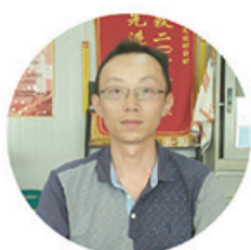
常州市康复医院迁建一期 张健

成本管控： 采用先进的施工方法和施工方案，降低工程成本。加强施工组织调配，加快工程进度，降低成本。