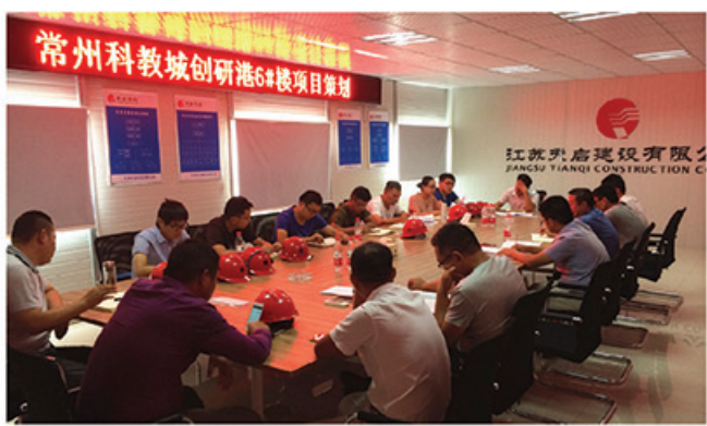
2016年8月31日,为规范项目管理、优化资源配置、提升项目管理水平,常州科教城创研港6#楼项目部召开项目策划会,对项目创优、技术交底等进行初步部署。