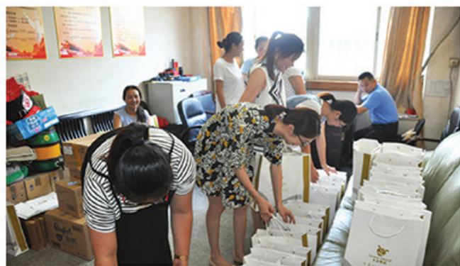
2016年8月12日,集团公司工会为全体员工购置夏日用品,让员工在酷暑天气中感受到公司的深切关怀。夏日“送清凉”是天启工会多年来的传统,是天启文化的一部分。