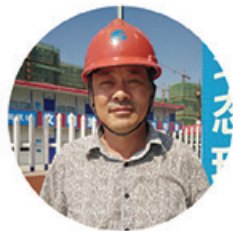
溧阳外国语学校新校区 阎传杰

成本管控： 采用先进的施工方法和施工方案，降低工程成本。加强施工组织调配，加快工程进度，降低成本。