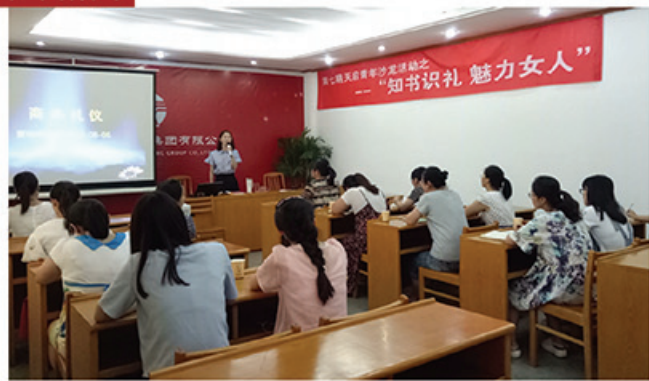
2016年8月6日,天启妇代会联合工会组织开展“知识礼、魅力女人”活动。从社交礼仪培训、美容养生知识分享、好书推荐这三个方面入手,做到内外兼修、知识礼,彰显集团公司女性风采。