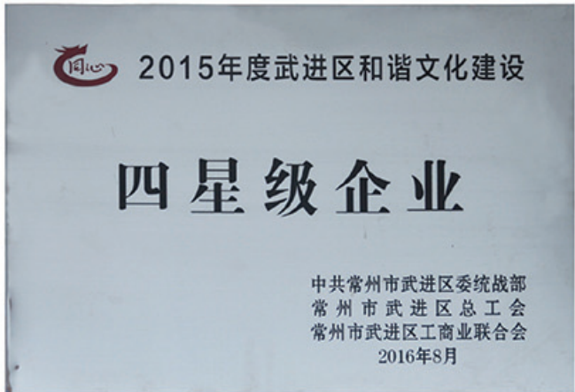
2016年8月30日,集团公司在全区非公有制经济人士理想信念报告会暨企业和谐文化建设提升行动推进会上荣获“武进区和谐文化建设四星级企业”称号。